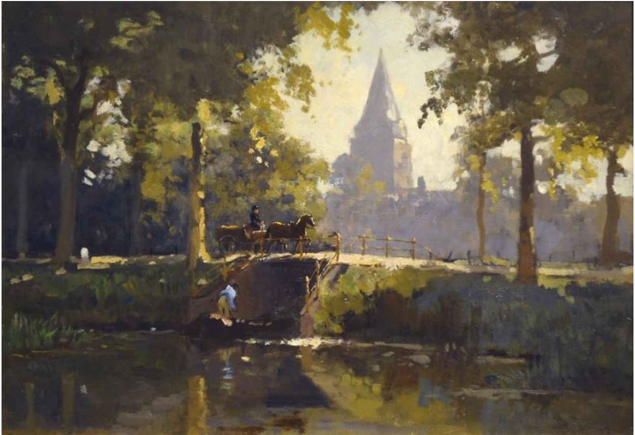
Gezicht op de Petruskerk te Woerden (1917) – (Foto: Frans Lander) – Lutherse Kerk, Woerden

Vreedenburg is lid van de kunstenaarsverenigingen Arti et Amicitiae te Amsterdam en St. Lucas in Laren. Hij is een geslaagd kunstenaar die veel prijzen ontvangt, onder meer in de Verenigde Staten. Vreedenburg overlijdt in 1946 in Laren.