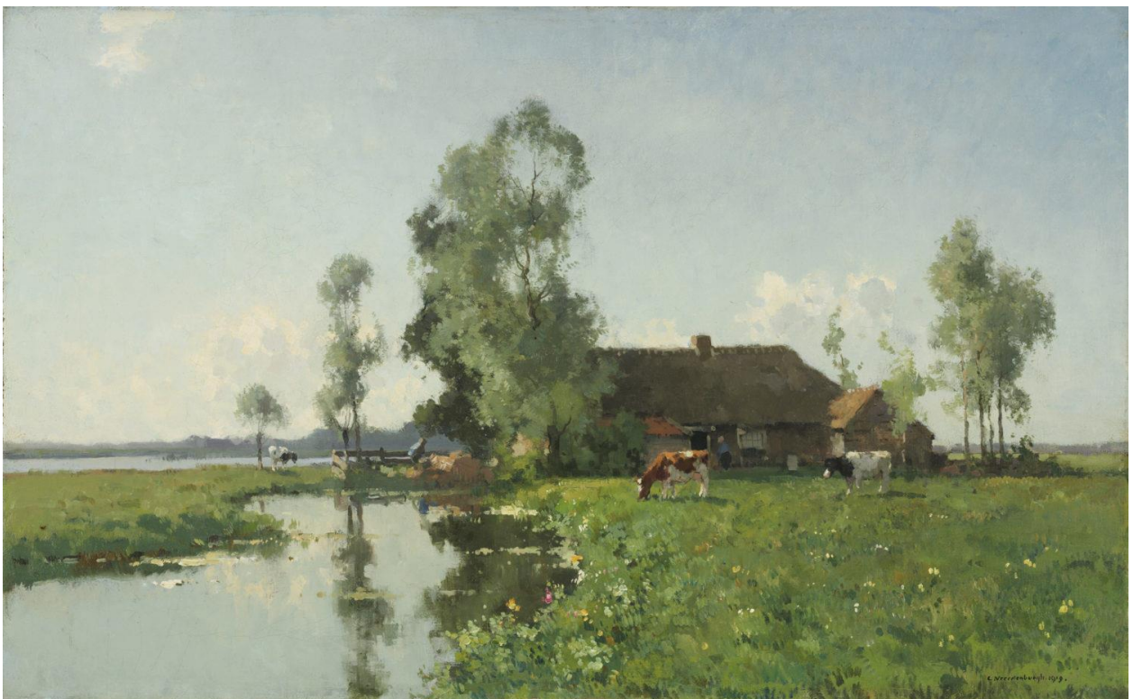
Polderlandschap (1919) – (Bron: Kunsthandel Mark Smit, Ommen)

Zijn grote doeken worden gekenmerkt door licht en water. Ze zijn opvallend sfeerrijk en meesterlijk van compositie en kleur. Het zijn levendige schilderijen die allemaal binnen de traditie van de Haagse School blijven. Zijn beeldtaal is voor iedereen herkenbaar.