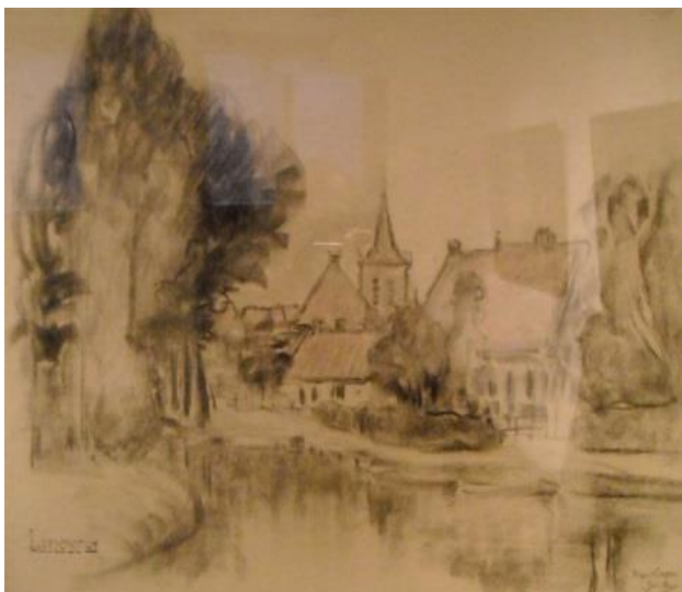
Linschoten – tekening (1937) – Stadsmuseum Woerden