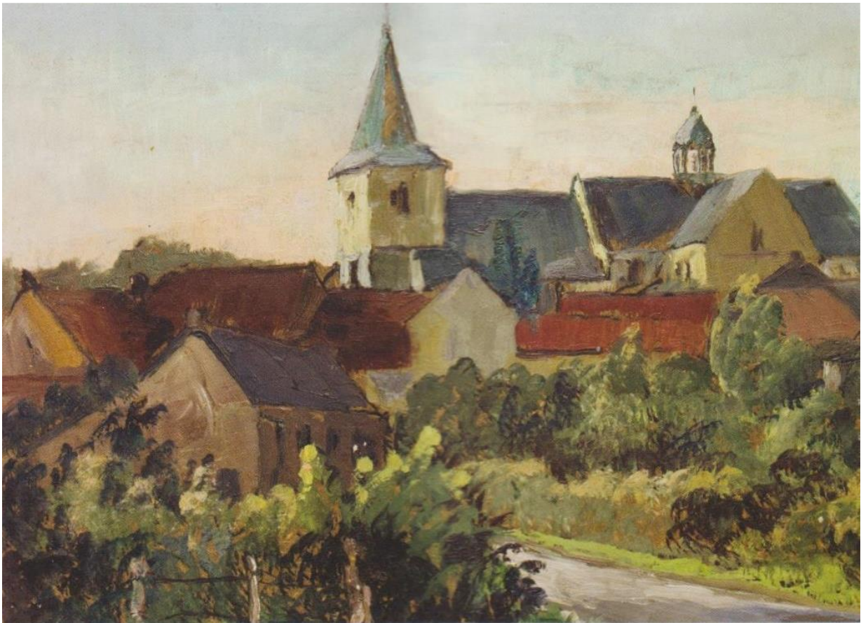
Dorpsgezicht met kerk – olieverf op hardboard – (1935) – Stadsmuseum Woerden