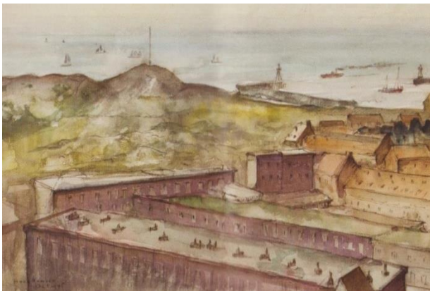
Interneringenkamp Duindorp – houtskool/krijt en aquarel (1945) – Stadsmuseum Woerden