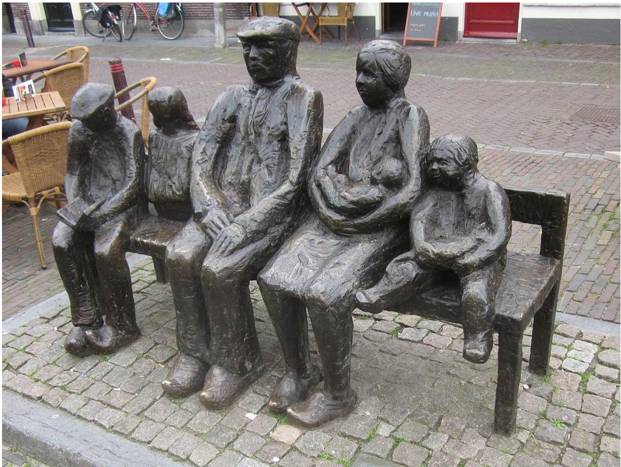
Boerenfamilie uit een werk van Herman de Man (1977) – Ineke van Dijk, Oudewater

Herman de Man is één van de bekendste Nederlandse schrijvers van streekromans . Een streekroman beschrijft personen of gemeenschappen in een duidelijk landelijke omgeving, veelal met een folkloristisch karakter en soms ook met gebruik van de streektaal. Het genre wordt in Nederland voor de Tweede Wereldoorlog zeer gewaardeerd maar dat verandert na de oorlog, in tegenstelling tot landen als België en Noorwegen. Juist schrijvers uit die landen, in het bijzonder de Vlaamse schrijver Stijn Streuvels (1871-1969), hebben het schrijven van Herman de Man duidelijk beïnvloed.