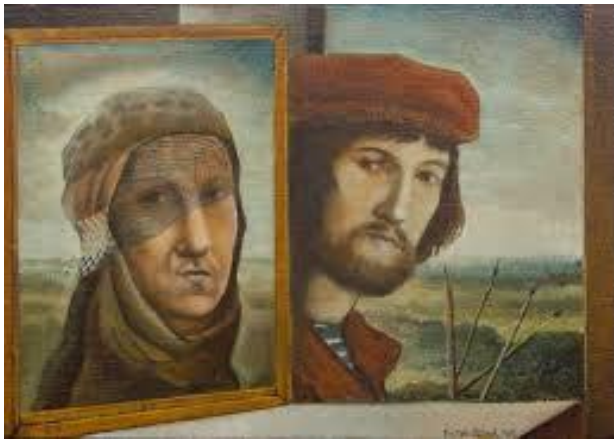
Pensées – (Bron: Jan Uytenbroek)

Kunst Artibus in Utrecht. Hij volgt daar de studie grafische en monumentale vormgeving. Het is een tamelijk traditionele opleiding. Nico ontwikkelt er zijn grote kennis en vakmanschap met een duidelijke voorliefde voor oude technieken. Hij heeft bijzondere belangstelling voor de technieken van oude schilders uit de Middeleeuwen en de vroege Renaissance. Daarom gebruikt hij, zoals de schilders uit die tijd, ook zogenaamde tempera-technieken . Het gaat daarbij om een mengsel van eigeel, water, olie en kleurstoffen (pigmenten). Je schildert dan niet op doek maar op houten panelen.