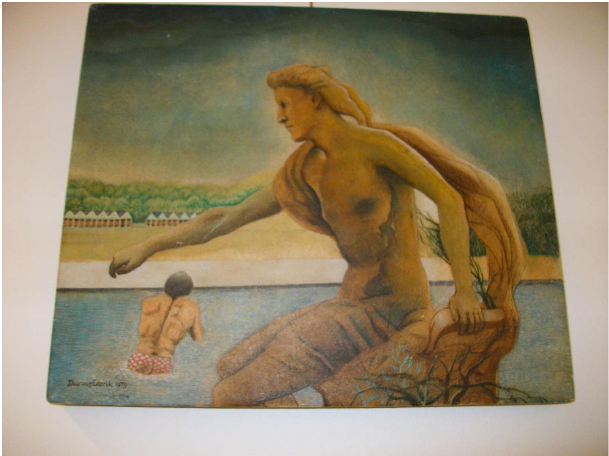
Zonder titel – Stedsmuseum Woerden