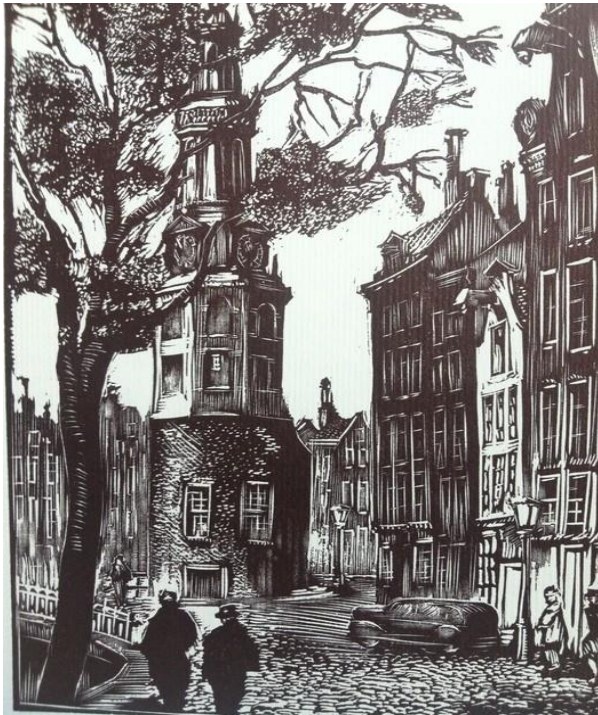
Houtsnede Montelbaanstoren Amsterdam (circa 1940)

Rein Snapper is in de eerste plaats graficus en buitengewoon vaardig in de houtsnede. In deze oude grafische techniek wordt de afbeelding in een blok hout uitgesneden met messen en gutsen. Daarvoor wordt meestal zacht hout gebruikt. De houtsnijkunst kenmerkt zich door de grove vormen, scherpe lijnen en opvallende zwart-wit contrasten. In de houtgravure waarbij vooral hard hout wordt gebruikt en scherpe messen, zijn de lijnen juist verfijnder. De delen die weggestoken worden in het hout, blijven in de afdruk wit. De andere delen worden zwart. Als het houtblok gereed is, wordt het afgedrukt met een drukpers. Het is een heel oude en eenvoudige prenttechniek, uitgevonden in China in de negende eeuw. Vanaf de Middeleeuwen verspreidt de techniek zich door Europa. De houtsnede-kunst wordt vooral beoefend in Japan en door de expressionisten in Vlaanderen en Duitsland (1910-1930). Vele grote kunstenaars beoefenen deze kunst, zoals Alfred Dürer . In Nederland is vooral M.C. Escher beroemd geworden door zijn zeer geraffineerde grafische afbeeldingen.